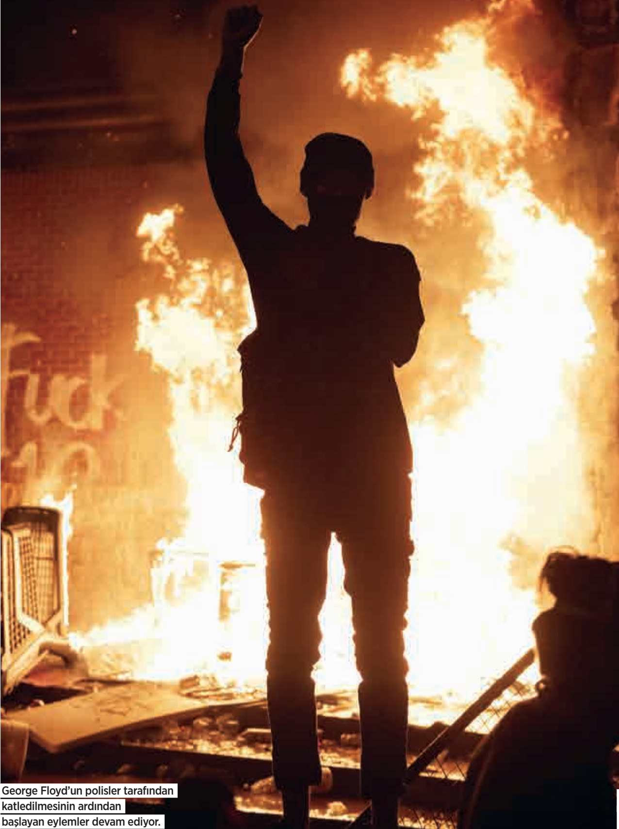
George Floyd'un polisler tarafından katledilmesinin ardından başlayan eylemler devam ediyor.

SİYAH vatandaşlara karşı polis şiddetine tepki çekmek için ABD ulusal marşı esnasında diz çöken ve o günden sonra adeta Amerikan futbol liginden aforoz edilen yıldız Colin Kaepernick, George Floyd'un öldürülmesine tepkisiz kalmadı. ABD'de George Floyd'un gözaltına alınırken polis tarafından boğazına basılarak öldürülmesine bir tepki de ırkçılığa karşı aktivist tutumuyla bilinen ünlü Amerikan futbol oyuncusu Colin Kaepernick'ten geldi.